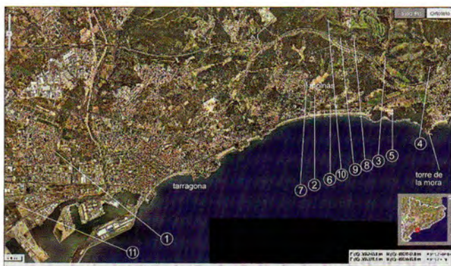
Figura 1. Localització dels masos (base ICC). 1. Torre Forta 2. Casa Madró 3. Mas Cusidor 4. Mas Jover 5. Mas Grímau 6. Mas Rabassa 7. Mas Hereuet 8. Mas Sorder 9. Mas de la Creu 10. Mas Pastoret 11. Mas dels Canonges.

D'aquest període en tenim exemples de masos fortificats al terme de Tarragona. El primer a portar a col·lació és el de la Torre Forta, a l'actual barri del mateix nom, i que en època moderna es coneixia com la torre d'Ambrosi Grosso (fig. 1). Es tracta d'un edifici quadrat, d'uns 12 per 9 m per uns 12 d'alt, amb planta baixa i dos pisos. Al seu interior hi ha tres crugies separades per dos arcs apuntats per sustentar els trespols. S'hi entra a peu pla per una porta de mig punt. Els murs són de maçoneria amb reforços de carreus als angles. És un edifici que hauríem de datar a finals de l'edat mitjana i presenta una sèrie d'espitlleres a diversos nivells que li donen el seu caràcter de mas fortificat. Com a construcció paral·lela, bé que més antiga, hi ha la torre d'en Dolça a Vilaseca. Es troba a uns 1200 metres de la línia teòrica de costa. Com les altres fortificacions a les quals ens referirem té la protecció de bé cultural d'interès nacional —BCIN— en virtut de l'aplicació del Decret de 22 d'abril de 1949 de protecció de l'arquitectura militar (Catàleg de béns immobles del Pla d'ordenació urbana municipal de Tarragona —POUM— fitxa F 011) (fig. 2.1).