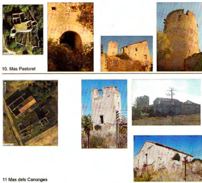
Figura 5. Mas Pastoret (10), dels Canonges (11). Ortofotografies ICC.