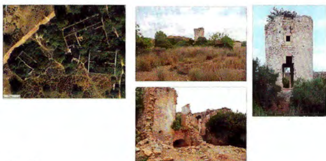
5. Mas Grimau