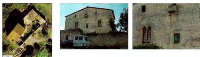
4. Mas Jover

Un altre exemple és al peu de l'antiga Via Augusta (de fet, a 650 metres de la Torre dels Escipions) i a 350 metres de la platja Llarga és el mas Rabassa (fig. 3.6). És una masia força ben conservada en un espai privilegiat on hi havia hagut una vil·la romana. L'actual configuració es forma per la casa dels masovers, al costat sud de l'N-340, coneguda com el Trull, on hi ha un conegut restaurant, i una sèrie de dependències presidides per una torre quadrada, al nord de la carretera.