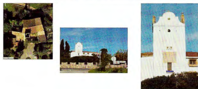
6. Mas Rabassa